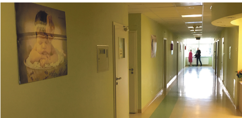
oddział ginekologiczno - położniczy

- Jaki będzie zakres usług w poradniach specjalistycznych?