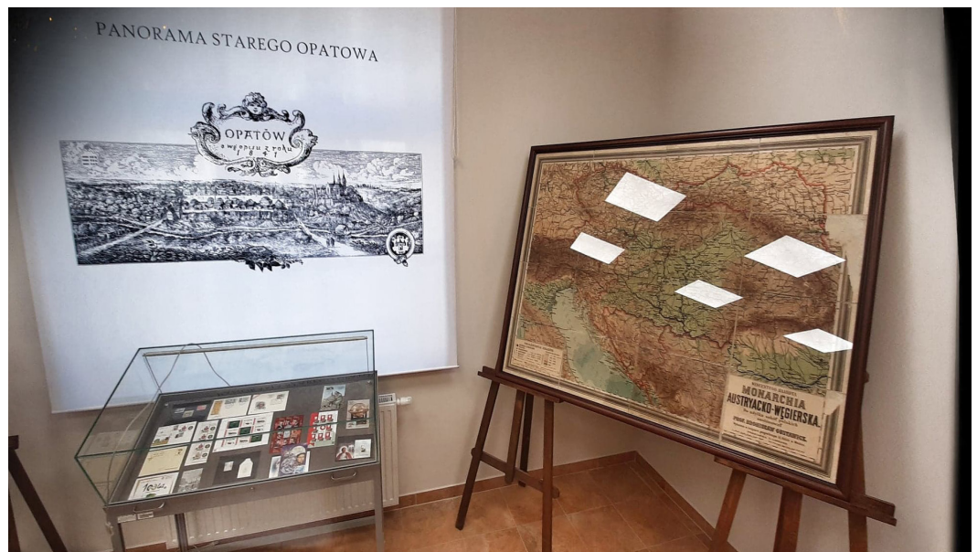
Wnętrze Muzeum Geodezji i Kartografii w Opatowie

Wszystkie przedmioty zostaną otoczone staranną opieką i zabezpieczone przed skutkami upływu czasu. Właśnie przedmioty przekazane przez darczyńców najczęściej posiadają swoją indywidualną, cenną dla nas historię. Niektóre z darów będziemy na bieżąco udostępniali na naszym profilu FB oraz stornie internetowej Domu Muzealnego - PCKTiR. Najcenniejsze eksponaty mają szansę znaleźć się na wystawie głównej i wystawach czasowych organizowanych przez Muzeum Geodezji i Kartografii w Opatowie.