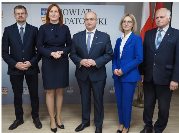
Członkowie Zarządu Powiatu Opatowskiego

W związku ze stanem epidemicznym na terenie całego kraju, w trosce o zdrowie seniorów, z inicjatywy radnych oraz Zarządu Powiatu Opatowskiego powstał Opatowski Zespół Pomocy Zakupowej.